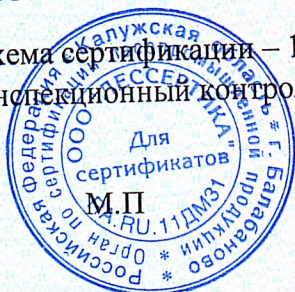
Схема сертификации – 1с(м). Инспекционный контроль – июнь 2022 года, июнь 2023 года.