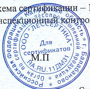
Схема сертификации – 1с(м). Инспекционный контроль – июль 2023 года, июль 2024 года.